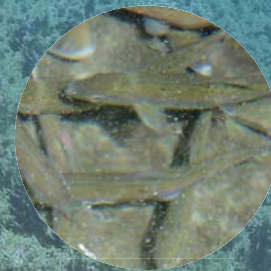
大会用に放流 約 2,000 匹