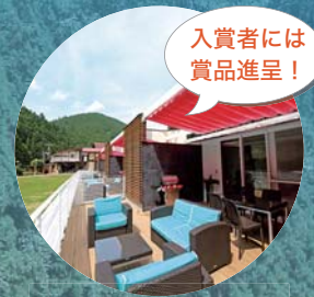
入賞者には 賞品進呈！