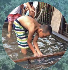
あまごのつかみどり 同時開催

貴志川の自然とふれあい、あまご釣りの楽しさを満喫！初めての方でもお気軽にご参加ください！